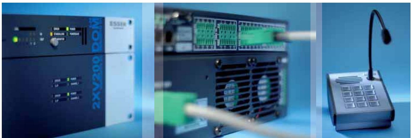
Die VARIODYN® D1-Systemkomponenten überzeugen mit ansprechendem Design und intuitiver Bedienbarkeit

ein umfangreiches Produktportfolio für unterschiedlichste Einsatzgebiete zur Verfügung – von digitalen Sprechstellen über Leistungsverstärker bis hin zum kompakten Komplettsystem.